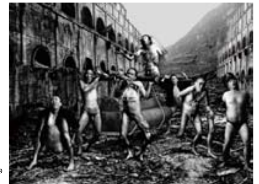
陳界仁《瘋癲城》1999 "La ciudad loca" 1999

陳界仁《失聲圖》所依據照片, 1946年內戰期間崇禪事件, 中央通訊社1946年12月照片(#2100), 陳界仁提供 "Afonía" se base en esta imagen, tomando en el año 1946 de Diciembre durante la Guerra Civil China. Agencia Central de Noticias (#2100). Ofrecida por Chen Chieh-Jen.